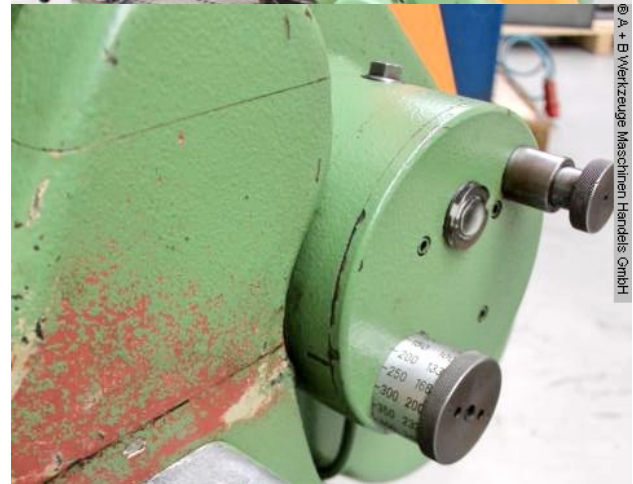
© A + B Werkzeuge Maschinen Handel GmbH