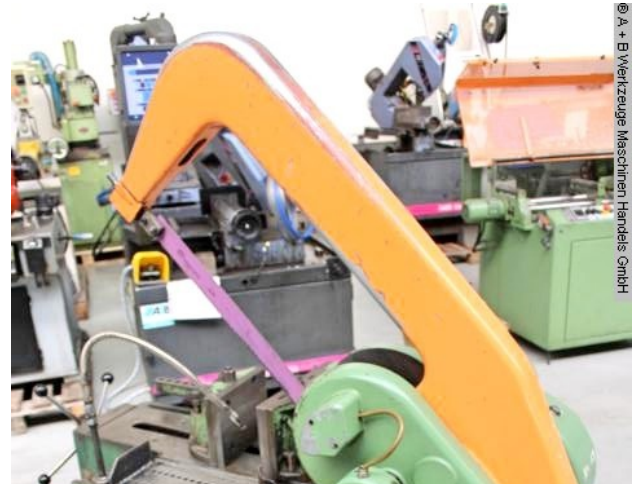
© A + B Werkzeuge Maschinen Handel GmbH