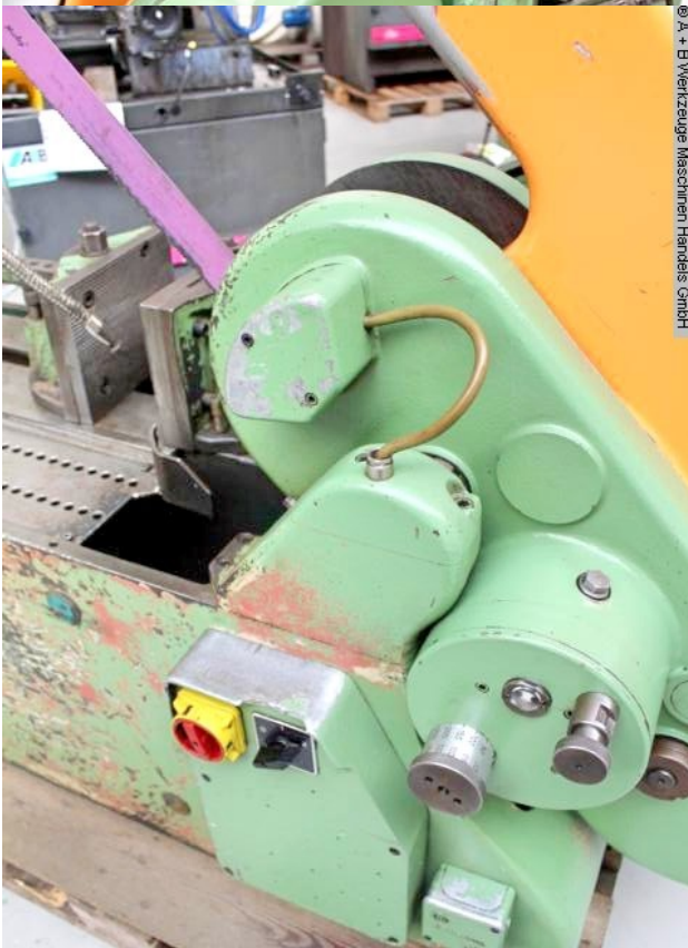
© A + B Werkzeuge Maschinen Handel GmbH