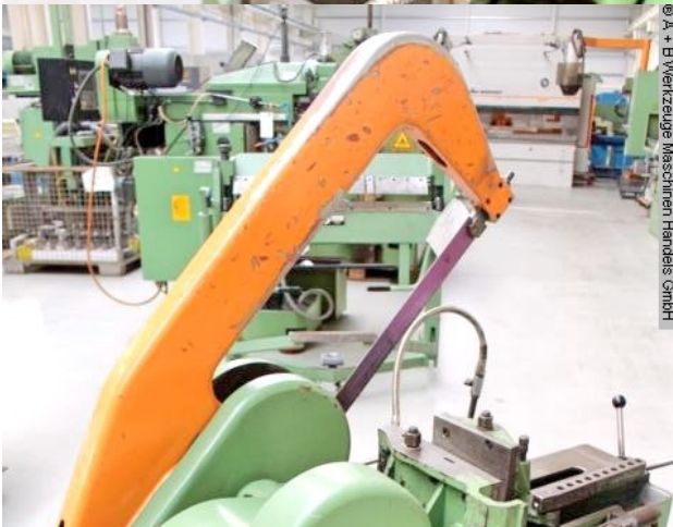
© A + B Werkzeuge Maschinen Handel GmbH