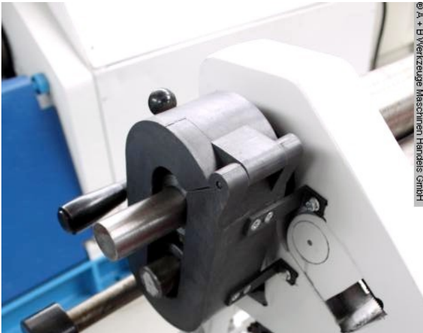
© A + B Werkzeuge Maschinen Handel GmbH

Schweißtechnik Lagereinrichtungen Industriebedarf Werkvertretungen Gebrauchtmachines