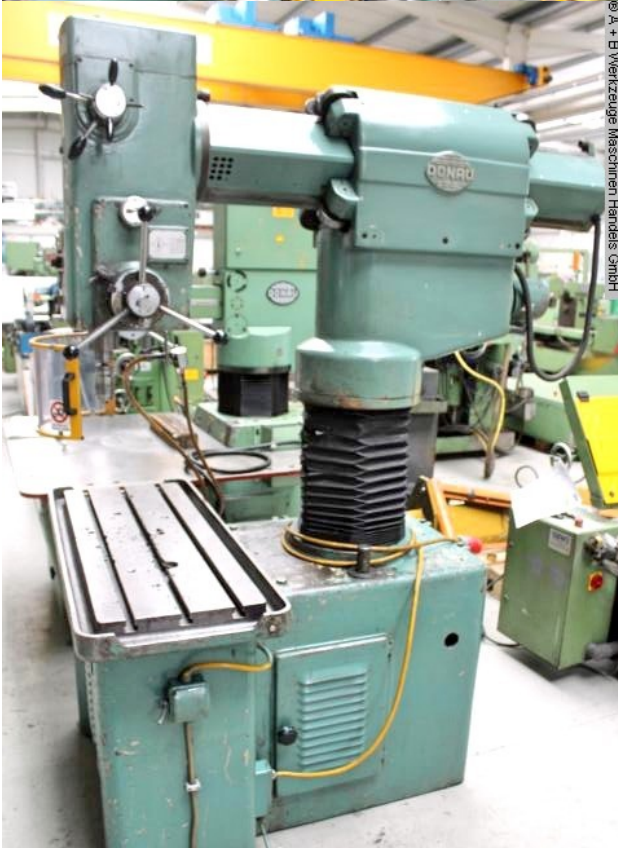
© A + B Werkzeuge Maschinen Handel GmbH