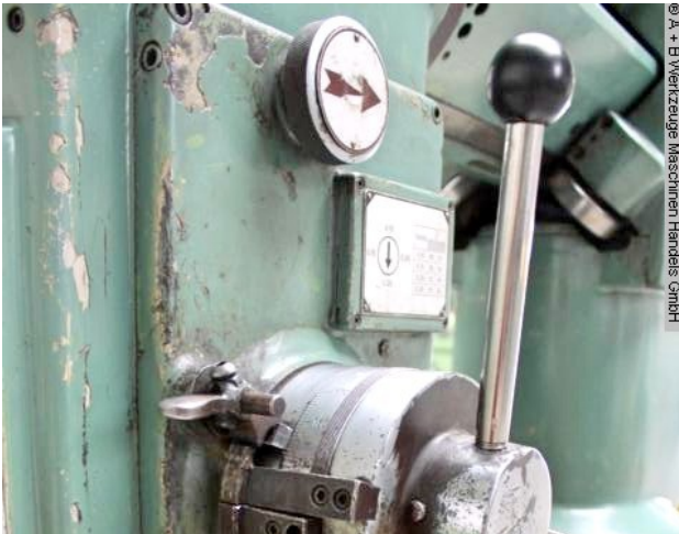
© A + B Werkzeuge Maschinen Handel GmbH

Schweißtechnik Lagereinrichtungen Industriebedarf Werksvertretungen Gebrauchsmaschinen