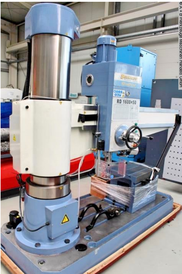
© A. B. Werkzeuge Maschinen Handel GmbH